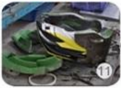
semi-finished In-mold helmet