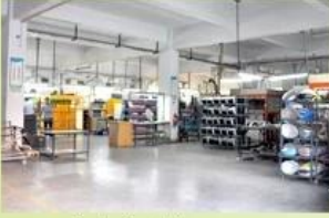
1. Helmet house

established in the year of 2012, more than 22 years experience. Expert in production of all kinds of helmets for different sports. Excellent quality, reasonable price, fast delivery makes us get very good reputation among our customers. Expert in OEM and ODM orders. Our skilled R&D team offers one stop service for throughout customers. 99% export and our main market is North America, European, Australia, Japan etc. Your enquiry is very welcomed and we will try our utmost to help you establish solid market. We are looking for long term relationship and get win win situation.