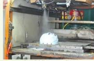
3. PC blister tooling