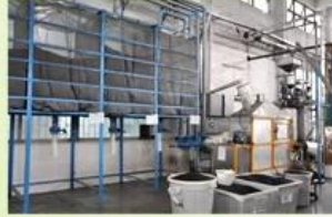
6. raw EPS material