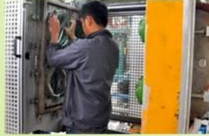
4. In-Mold producing process