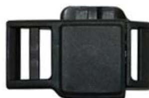
Fidlock magnetic buckle

We can also customize various colors buckle.