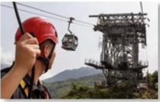
Cable car maintenance