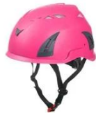
Pink pantone 806