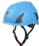
Navy blue pantone 7689 C