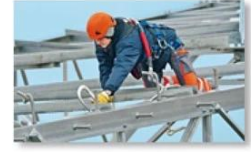
Work at height