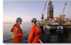
Offshore oil and gas