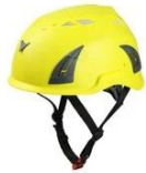
Yellow pantone 3965 U