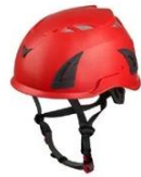
Red pantone 185 C