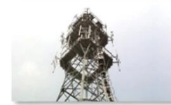
Mobile plant maintenance