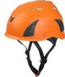
Orange pantone 165 C