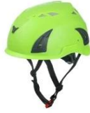
Lime green pantone 375 C