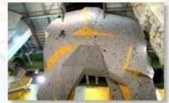
Big wall climbing