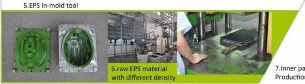
5. EPS In-mold tool