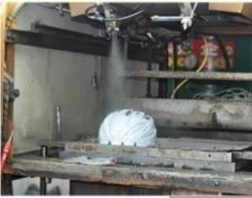
3. PC blister tooling