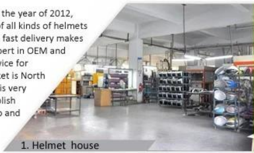
1. Helmet house

Shenzhen Aurora Sports Goods Co., LTD established in the year of 2012, more than 22 years experience. Expert in production of all kinds of helmets for different sports. Excellent quality, reasonable price, fast delivery makes us get very good reputation among our customers. Expert in OEM and ODM orders. Our skilled R&D team offers one stop service for throughout customers. 99% export and our main market is North America, European, Australia, Japan etc. Your enquiry is very welcomed and we will try our utmost to help you establish solid market. We are looking for long term relationship and get win win situation.