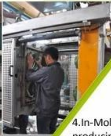
4. In-Mold producing process