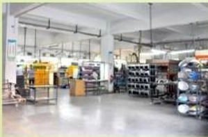
1. Helmet house

established in the year of 2012, more than 22 years experience. Expert in production of all kinds of helmets for different sports. Excellent quality, reasonable price, fast delivery makes us get very good reputation among our customers. Expert in OEM and ODM orders. Our skilled R&D team offers one stop service for throughout customers. 99% export and our main market is North America, European, Australia, Japan etc. Your enquiry is very welcomed and we will try our utmost to help you establish solid market. We are looking for long term relationship and get win win situation.