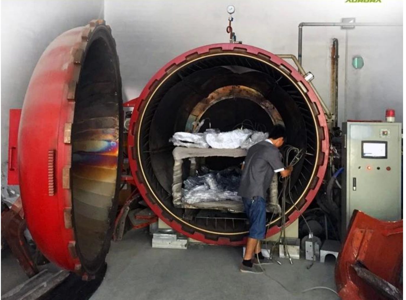
Raw Material Show: