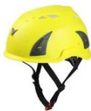
Yellow pantone 3965 U