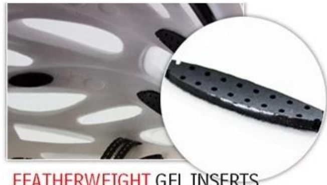
FEATHERWEIGHT GEL INSERTS