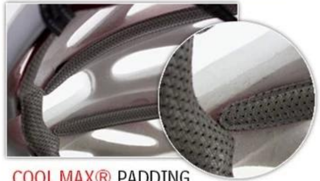
COOL MAX® PADDING