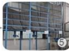
Eps raw material by different density