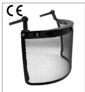
Iron mesh faceshield EN 1731

3) Kask ochronny z plastikowym wizjerem Zestaw jest kompatybilny z naszym specjalny daszek i nauszники : Przyłbica Plastik z okiem Ochrona, Nauszniki .