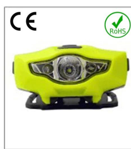
Versatile LED headlight 1A EN 55015: 2006