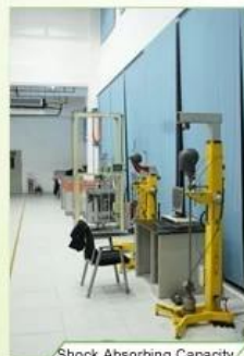
Shock Absorbing Capacity