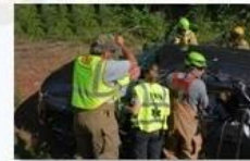
Rescue and evacuation