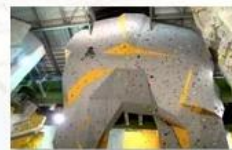
Big wall climbing