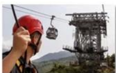
Cable car maintenance