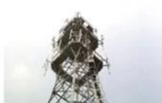
Mobile plant maintenance