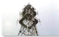
Mobile plant maintenance