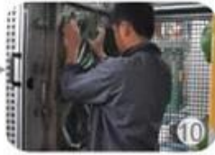
In-mold producing process