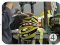
Trimming dug hole