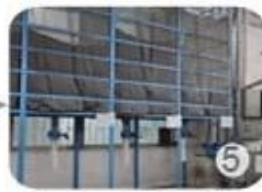
Eps raw material by different density