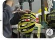
Trimming dug hole