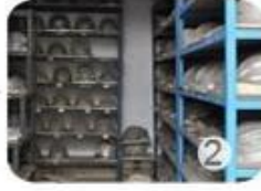
PC blister tooling