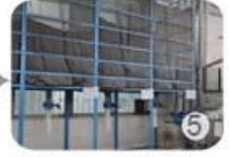
Eps raw material by different density