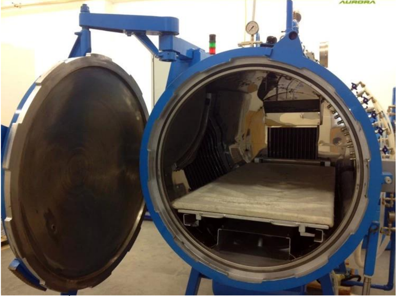
التشذيب وأمبير. منطقة الرسم. 3.