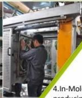
4. In-Mold producing process