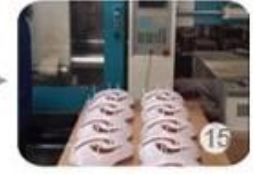
Plastic injection workshop