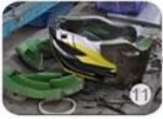
semi-finished In-mold helmet