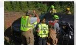
Rescue and evacuation