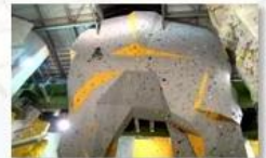
Big wall climbing