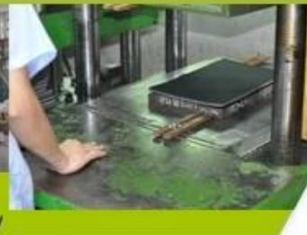
7. Inner padding Production