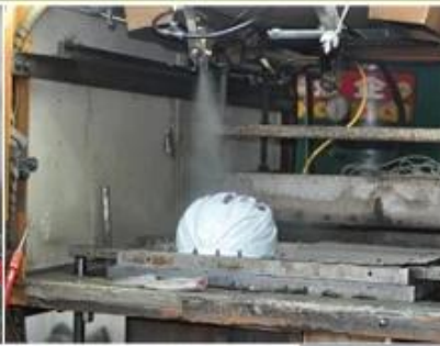
3. PC blister tooling