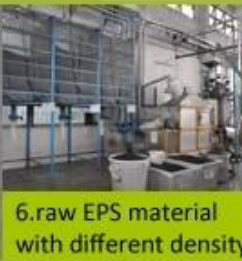
6. raw EPS material with different density