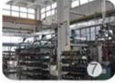
Helmet in-mold workshop