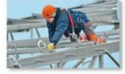
Work at height