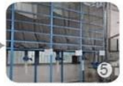
Eps raw material by different density