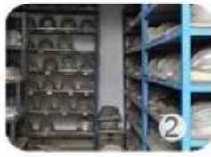
PC blister tooling