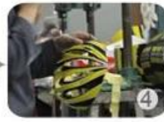
Trimming dug hole