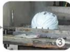
PC blister manufacture