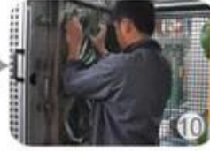
In-mold producing process