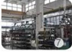
Helmet in-mold workshop