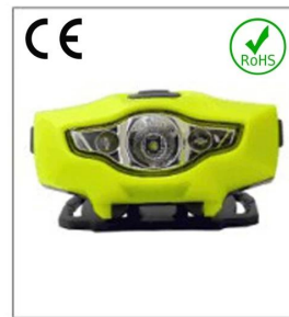
Versatile LED headlight 1A EN 55015: 2006