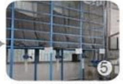
Eps raw material by different density