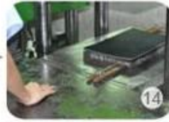
Inner padding production