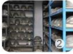
PC blister tooling