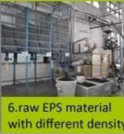
6. raw EPS material with different density