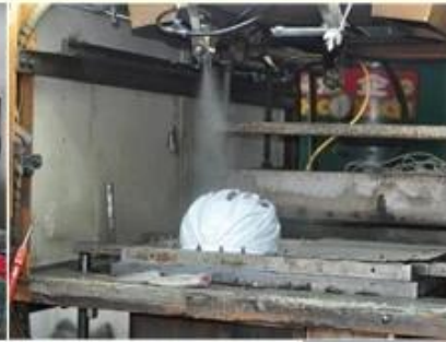
3. PC blister tooling