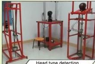
Head type detection