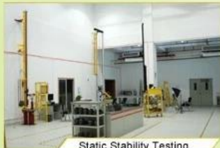
Static Stability Testing