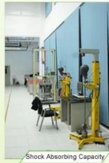
Shock Absorbing Capacity