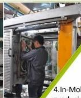
4. In-Mold producing process