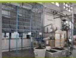
6. raw EPS material with different density