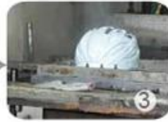
PC blister manufacture