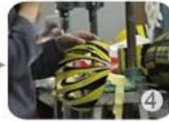
Trimming dug hole