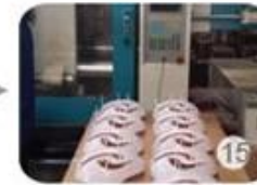
Plastic injection workshop