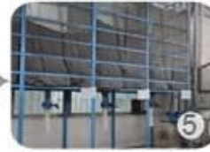
Eps raw material by different density