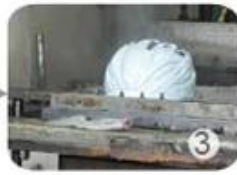
PC blister manufacture