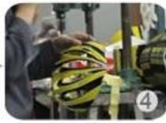
Trimming dug hole