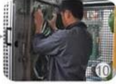
In-mold producing process