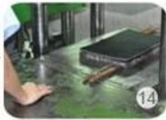
Inner padding production