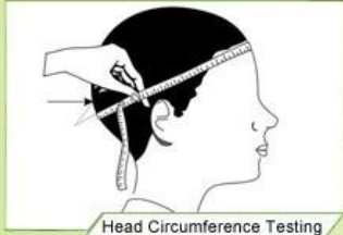
Head Circumference Testing