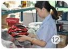
12 IQC inspection