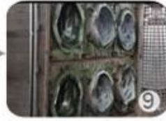
9 In-mold tooling