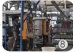
8 In-mold machines