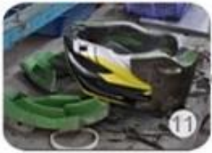
11 semi-finished In-mold helmet