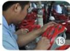
13 Helmet grinding