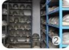
2 PC blister tooling