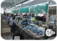
16 Assembly line