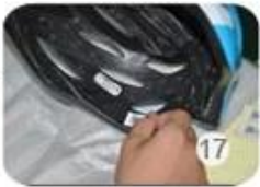
17 Inside labeling