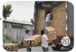
20 Installed counters