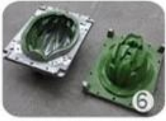
6 EPS in-mold tooling