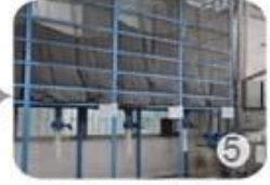
5 Eps raw material by different density