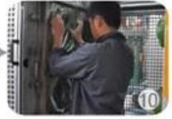
10 In-mold producing process