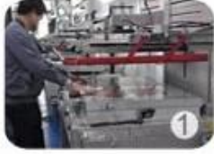
1 Silk screen