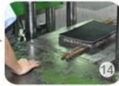
14 Inner padding production