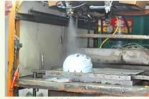
3. PC blister tooling