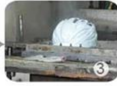
PC blister manufacture