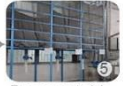
Eps raw material by different density