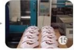
Plastic injection workshop