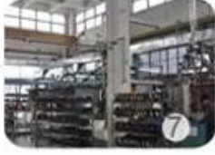
Helmet in-mold workshop