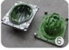
EPS in-mold tooling