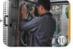
In-mold producing process