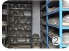
PC blister tooling