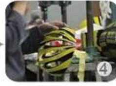
Trimming dug hole