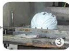
PC blister manufacture