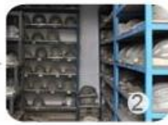
PC blister tooling