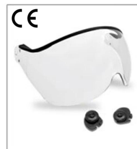
New developed clear visor EN266