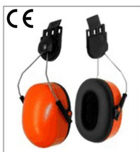
Noiseproof earmuff EN 352-3:2002