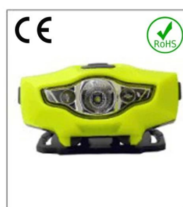
Versatile LED headlight 1A EN 55015: 2006