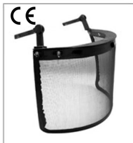
Iron mesh faceshield EN 1731

3) Ochranná přilba s plastovým štítem Sada je kompatibilní s naší speciální kšilt a chránič sluchu : Hledí plast s okem ochrana, Klapka na uši .