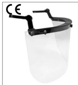
EN 166 ANSI Z87.1