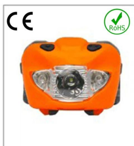
Versatile LED headlight 3A EN 61547:2009