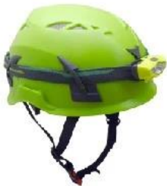
MODEL : 1A

***All above data tested for 100% real & accuracy