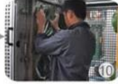
In-mold producing process