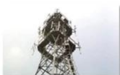
Mobile plant maintenance