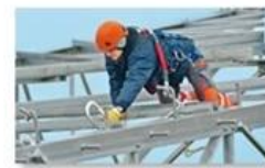
Work at height