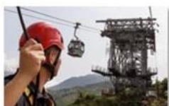
Cable car maintenance