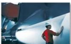
Pulp & paper