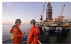
Offshore oil and gas