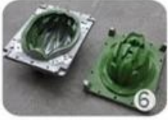
EPS in-mold tooling