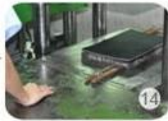
Inner padding production