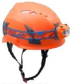
MODEL : 3A