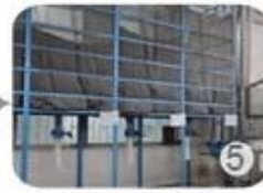
Eps raw material by different density