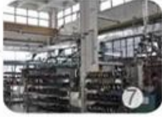
Helmet in-mold workshop