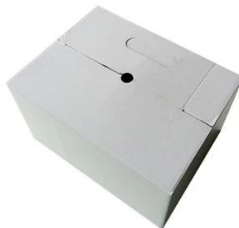
9 boxes/carton Master carton: 68*32*54cm