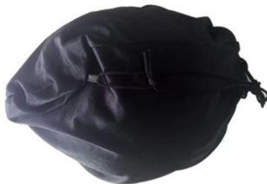
Soft cloth bag