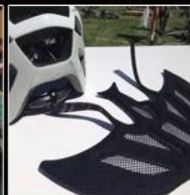
4. Final Production Stage