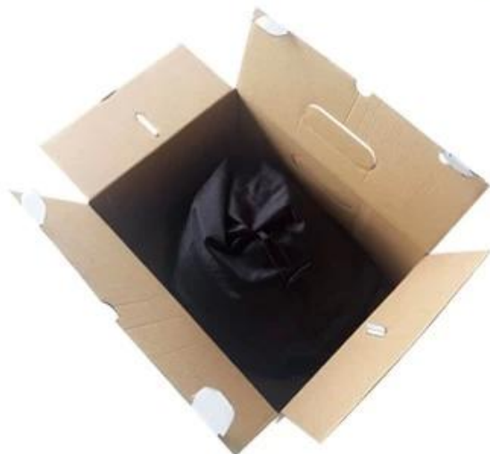
Cloth bag + Box Packaging White Box size: 31*23*18cm