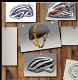
1. Trend predictions