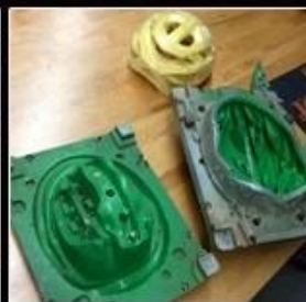
3. Development Stage