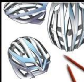
2. Conception Ideation