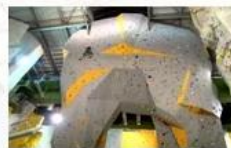
Big wall climbing