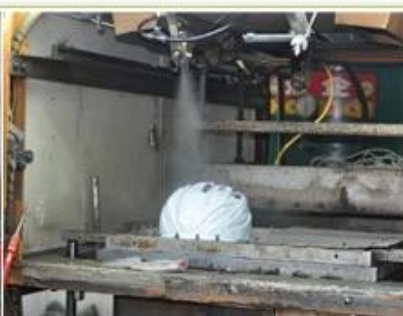
3. PC blister tooling