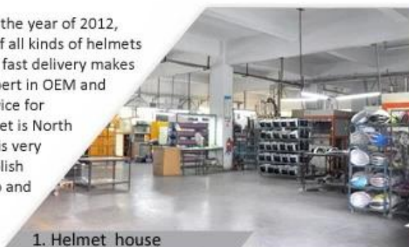
1. Helmet house

Shenzhen Aurora Sports Goods Co., LTD established in the year of 2012, more than 22 years experience. Expert in production of all kinds of helmets for different sports. Excellent quality, reasonable price, fast delivery makes us get very good reputation among our customers. Expert in OEM and ODM orders. Our skilled R&D team offers one stop service for throughout customers. 99% export and our main market is North America, European, Australia, Japan etc. Your enquiry is very welcomed and we will try our utmost to help you establish solid market. We are looking for long term relationship and get win win situation.