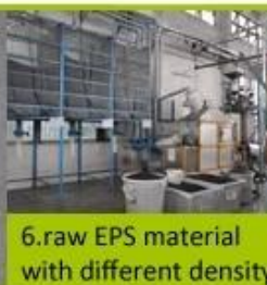
6. raw EPS material with different density