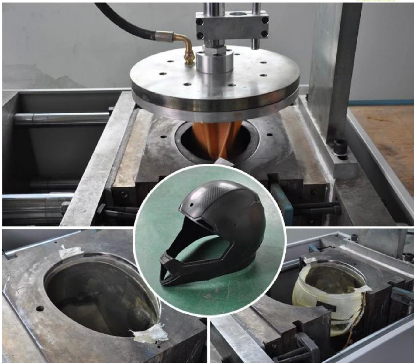
2. Zpracování v autoklávu (vakuově balené)