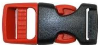
ITW standard helmet buckle