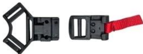
Patent self-developed magnetic buckle