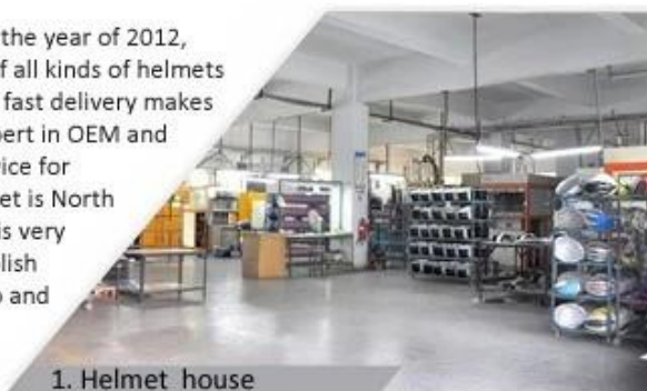
1. Helmet house

Shenzhen Aurora Sports Goods Co., LTD established in the year of 2012, more than 22 years experience. Expert in production of all kinds of helmets for different sports. Excellent quality, reasonable price, fast delivery makes us get very good reputation among our customers. Expert in OEM and ODM orders. Our skilled R&D team offers one stop service for throughout customers. 99% export and our main market is North America, European, Australia, Japan etc. Your enquiry is very welcomed and we will try our utmost to help you establish solid market. We are looking for long term relationship and get win win situation.