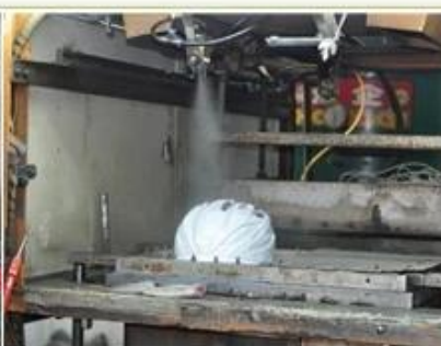
3. PC blister tooling