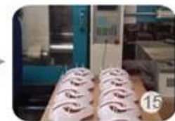
Plastic injection workshop