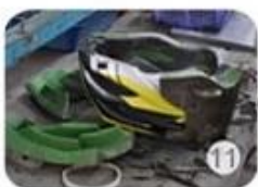
semi-finished In-mold helmet