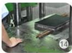
Inner padding production