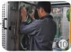
In-mold producing process