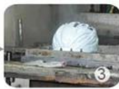
PC blister manufacture