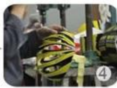
Trimming dug hole