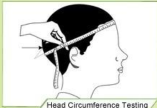
Head Circumference Testing