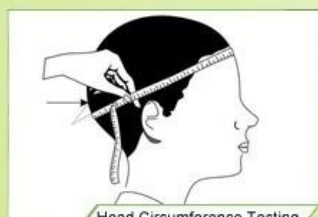
Head Circumference Testing