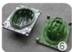
EPS in-mold tooling