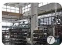
Helmet in-mold workshop