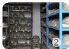
PC blister tooling