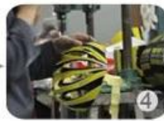
Trimming dug hole