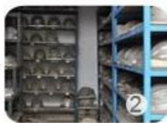
PC blister tooling