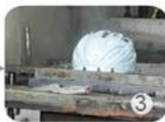
PC blister manufacture