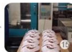
Plastic injection workshop