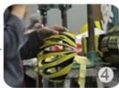
Trimming dug hole