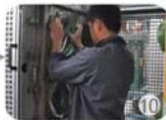
In-mold producing process