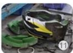
semi-finished In-mold helmet