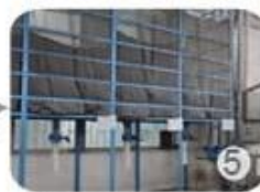
Eps raw material by different density